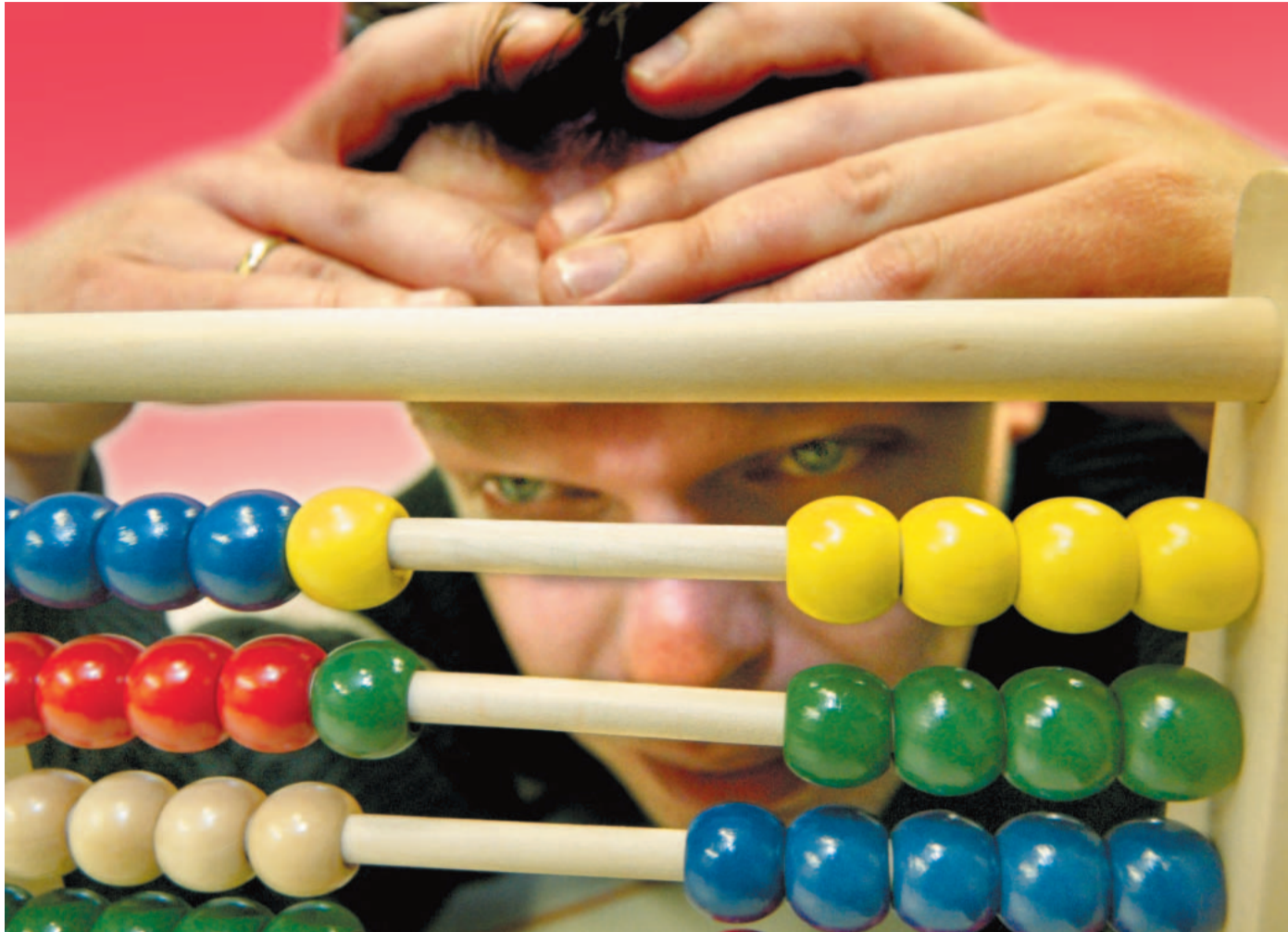
Verzweifeln schon beim leichten Rechnen: FH-Studenten für Maschinenbau haben Probleme mit dem Schulstoff.

■ Bielefeld (cos). Im Jahr 2002 mussten 3.443 Autofahrer pusten, 576 hatten zu viel getrunken, 520 mussten eine Blutprobe abgeben. 386 verloren wegen Trunkenheit ihren Führerschein. 271.330 Autos gerieten in eine Radarkontrolle, 11.214 (4 Prozent) waren zu schnell, 1.378 über 21 Stundenkilometer zu schnell. 369 Autofahrer verloren wegen überhöhter Geschwindigkeit ihren Führerschein. Nach Angaben der Polizei können sich Autofahrer auf verstärkte Alkohol-Kontrollen in der Karnevalszeit einrichten.